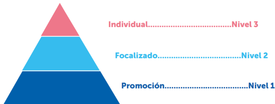
FIGURA 3. MODELO DE ESCUELA TOTAL MULTINIVEL

Por último, es importante señalar que desde el 2023, el Mineduc propone trabajar desde el Modelo de escuela total multinivel.